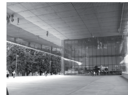
Linz: Das neue Kunstmuseum Lentos

hingegen eine originelle Lösung für zwei aktuelle Probleme in der Arbeitswelt: den Mangel an Arbeitskräften in