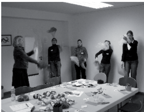
Die fünf Young Members aus Deutschland, Österreich, der Schweiz und Slowenien in Aktion am DACH-Treffen.

Damit dies künftig nicht passiert, haben wir unsere Ziele für die nächste Lohn-