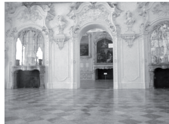
Prächtige Barocksäle in Schloss Schleissheim.

Ein in echt bayerischer Gastlichkeit gehaltenes Mahl beendete stilvoll den Besuch des Münchner Schwesterverbandes. Die Teilnehmerinnen des SVA bedanken