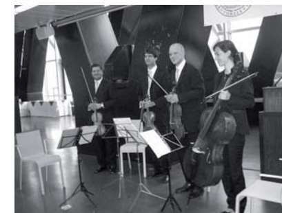
Quatuor des « Wienersymphoniker »

nier étage du bâtiment moderne du Juridicum, la Faculté de droit de l'Université de Vienne.